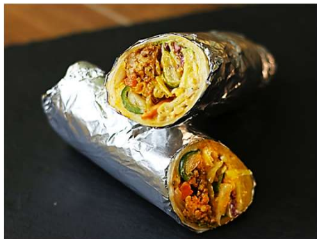
Salsa Tacos Meat Burrito