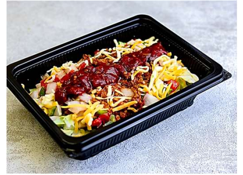
Chipotle (extremely hot)