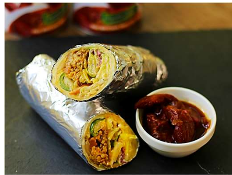
Chipotle Tacos Meat Burrito